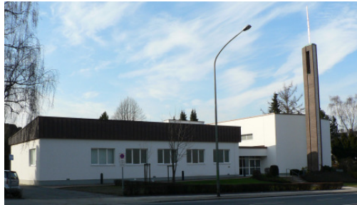
Ansicht nach der Renovierung 2006

Um etwa 1914 siedelten sich mehrere Familien in Essen an. Nach