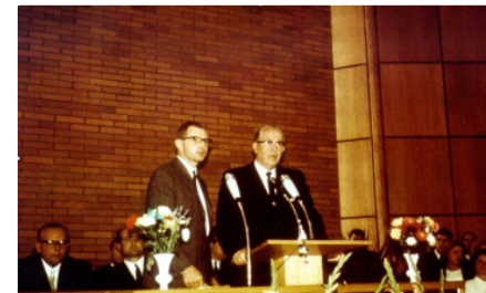
Ezra Taft Benson am Podium des Essener Gemeindehauses Gemeinde

erbracht. Die Gelder wurden in nächtelanger Heimarbeit von insgesamt 15.000 Stunden - beauftragt von den Kruppchen Grafischen Anstalten - von den Mitgliedern erwirtschaftet. Am 29.8.1965 erfolgte die feierliche Einweihung der Kirche durch